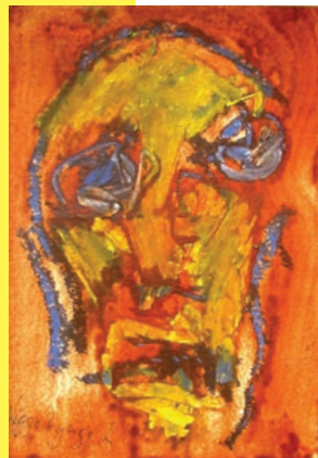
Viggo Lynge Larsen